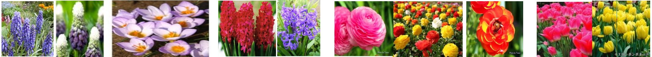
ムスカリ(ゆい科) クロッカス (きく科) ヒヤシンス(ゆい科) レナンキュラス (きんぽうげ科) チューリップ(ゆい科)

これらの花は、地域の方々・卒業生及び保護者と学校で協力して「青南ガーデニングクラブ」で植えています。