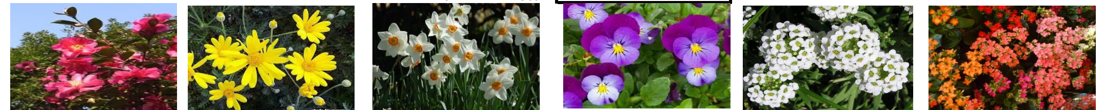
さざんか (あぶらな科) エリオステージ (きく科) 白いせん (ひがなばな科) ビオラ (すみれ科) アリッサム (あぶらな科) カランコエ (ベンケイソウ科)