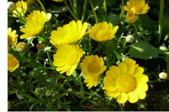
クリサンセマム・ムルチコーレ (きく科)