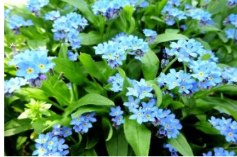
わすれなぐさ (むらさき科)