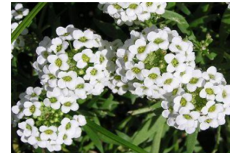
アリッサム (あぶらな科)