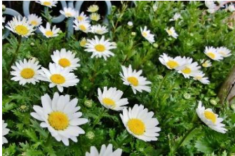
ノースポール (きく科)