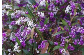
ハーデンベルギア (まめ科)