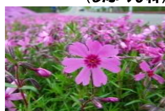
しばざくら (はなしのぶ科)