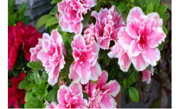
アザレア (つつじ科)