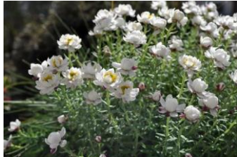
はなかんざし (きく科)