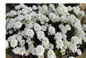
イペリス (あぶらな科)