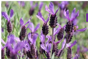
ラベンダー (しそ科)