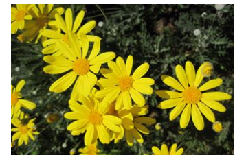
ユリオフステージ (きく科)