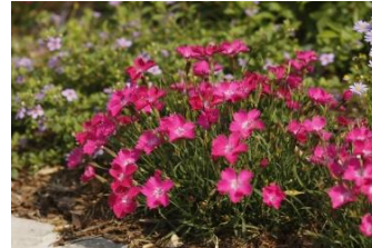
なでしこ (なでしこ科)