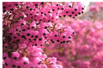
ジャノメ エリカ (つつじ科)