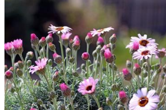
ローダンセマム (きく科)