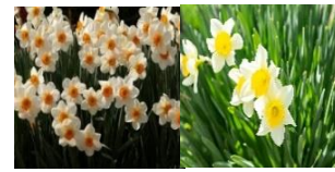
水仙(ひがなばな科)