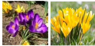
クロッカス(きく科)