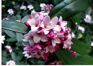
沈丁花 (じんちょうげ科)