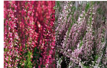
カルーナ (つつじ科)