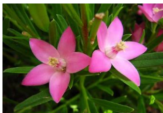
サザンクロス (みかん科)