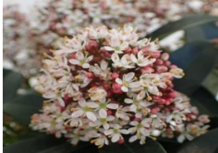
スキミヤ (みかん科)