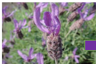
ラベンダー (しそ科)