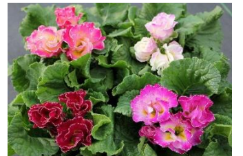
フイルラ (さくらそう科)