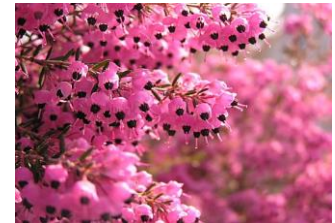
ジャノメ エリカ (つつじ科)