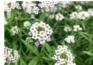
アリッサム (あぶらな科)