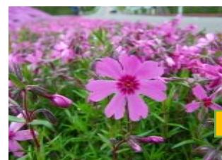
しばざくら (はなしのぶ科)