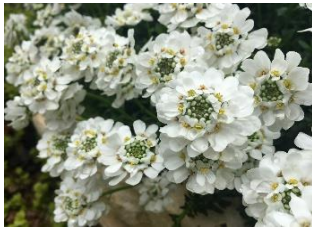
イペリス (あぶらな科)