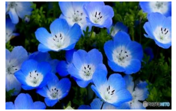
ネモフィラ (おらさき科)