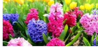
ヒヤシンス(ゆい科)