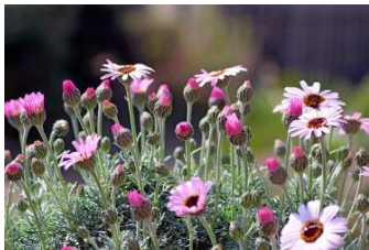
ローダンセマム (きく科)

芝桜は、秋の作業は、子供達の使った土に肥料を混ぜて上からのせてみました。来年も沢山の花が咲きますように。