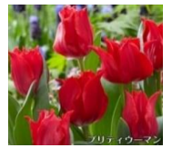
チューリップ(ゆい科)