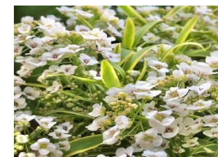
スパークリアム (あぶらな科)